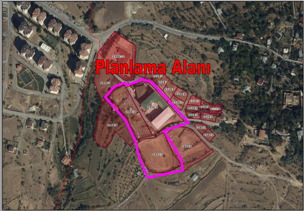
Resim 3: Planlama Alanının Mülkiyet Durumu

Planlama alanı; tapuda Talas İlçesi, Endürlük Mahallesi sınırları içerisinde, özel mülkiyete ait 2956 ada 2 ve 3 parsel numaralı taşınmazlar ile 2953 ada 2 parsel numaralı taşınmaz üzerinde bulunmaktadır. (Bkz. Resim 3)