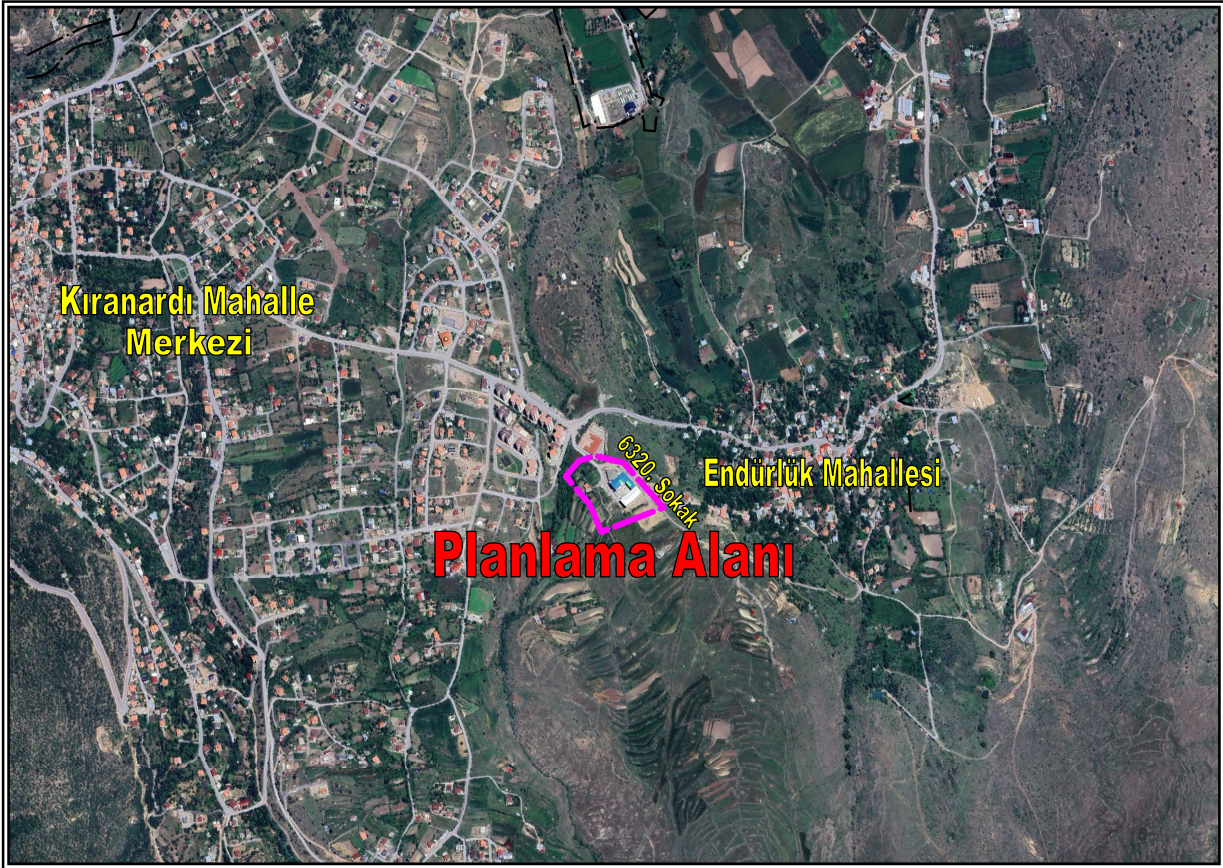
Resim 1: Planlama Alanının Konumu

Planlama alanı eğimli bir arazi yapısına sahiptir. Bahse konu alanın bir kısmı üzerinde okul kullanımlı yapı bulunmakta iken geriye kalan kısmı boş arsa statüsündedir. Planlama alanının yakın çevresinde ise okul, tek katlı konut kullanımlı yapılar, doğal karakterli boş araziler ve tarım arazileri yer almaktadır.